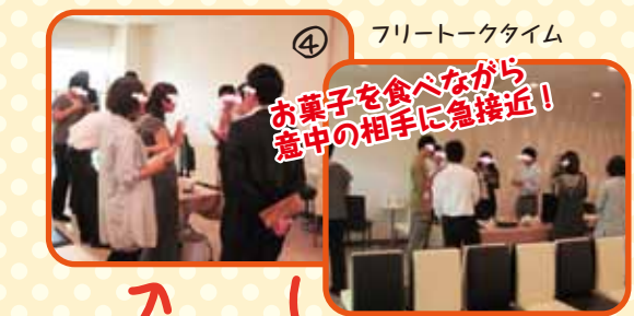
④ フリータイム お菓子を食べながら意中の相手に急接近!