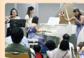
ランチタイムコンサートの様子