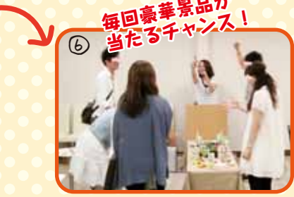
⑥ 毎回豪華景品が当たるチャンス! じゃんけん大会