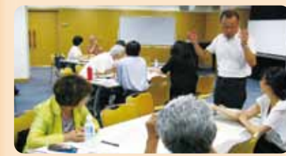
「まちづくり講座」の様子

総合生涯学習センターでは、語学やパソコン等資格取得のための講座・イベントの実施や、ボランティア講師の紹介も行っています。また、「フラダンス」「バルーンアート」といった40以上の市民団体の活動をサポート。毎月1回家族連れで楽しみいただけるランチタイムコンサートも開催していますので、お気軽にお立ち寄りください。