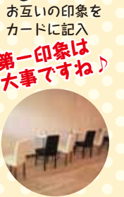
③ お互いの印象をカードに記入 第一印象は大事ですね!